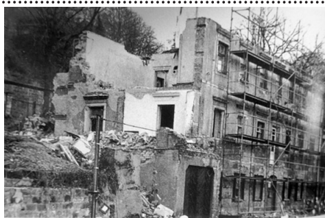
Abriss des Atelier- und Wohnhauses im Sommer 1988

Die Grabstätte wurde im Rahmen der statischen Wandgrabmalsicherungen vom Trinitatisfriedhof her rückverankert und durch eine Blechabdeckung gegen weitere Verwitterung geschützt. Die Jüdische Gemeinde zu Dresden und der Architekt Matthias Voigt planen das Restaurierungskonzept. Das Grabmal