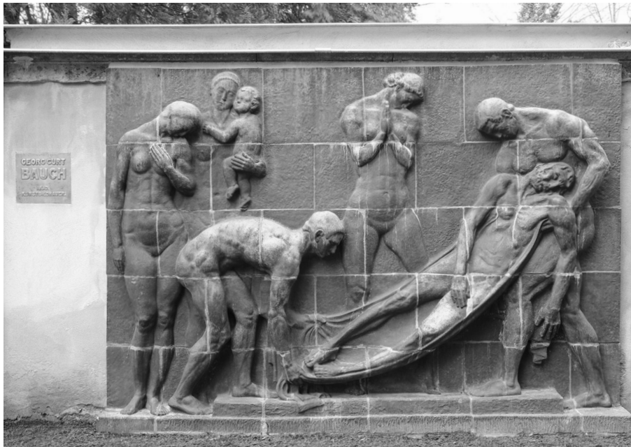
Das Grablegungsrelief von Georg Curt Bauch im März 2024 am neuen Standort auf dem Loschwitzer Friedhof, links sein Original-Türschild.