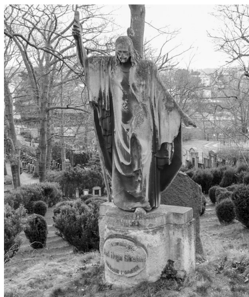
»Göttlicher Wanderer«, 1912, Höhe mit Sockel 3,56 m, Neuer Johannisfriedhof Meißen